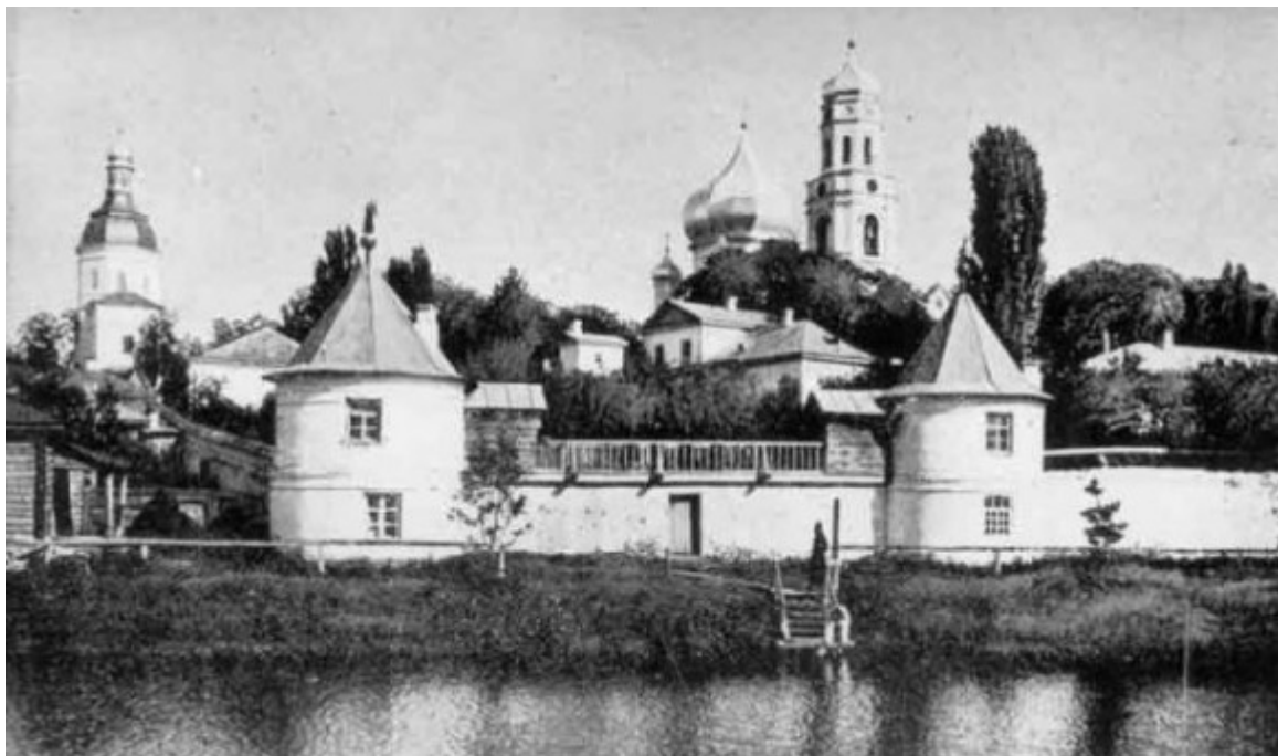
Glinská poustevna před revolucí